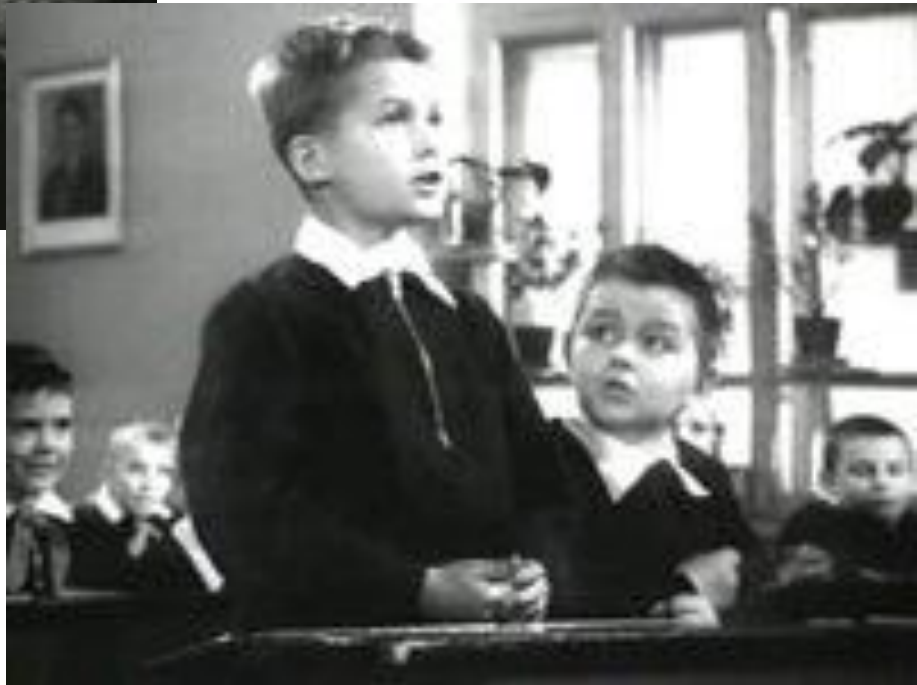
«Алёша Птицын вырабатывает характер» — фильм 1953 года киностудии «Ленфильм»