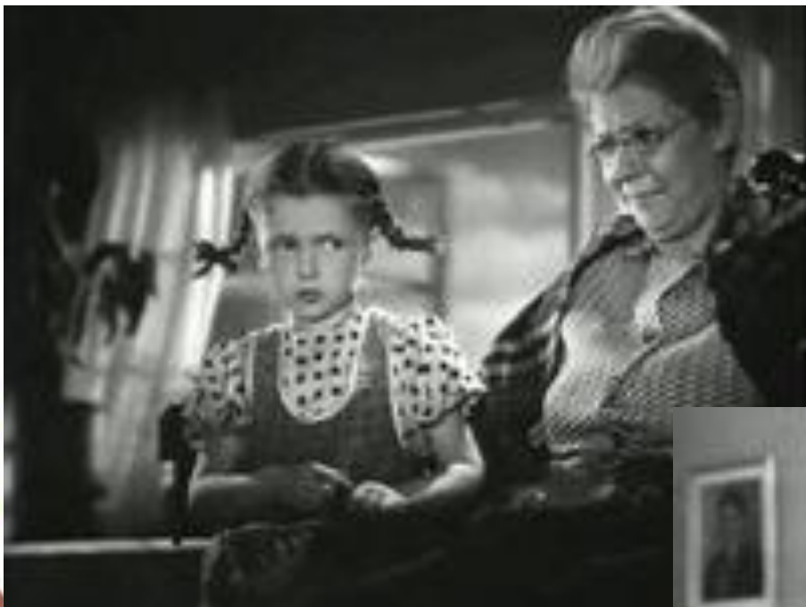
«Слон и верёвочка» — фильм 1945 года киностудии «Союздетфильм»