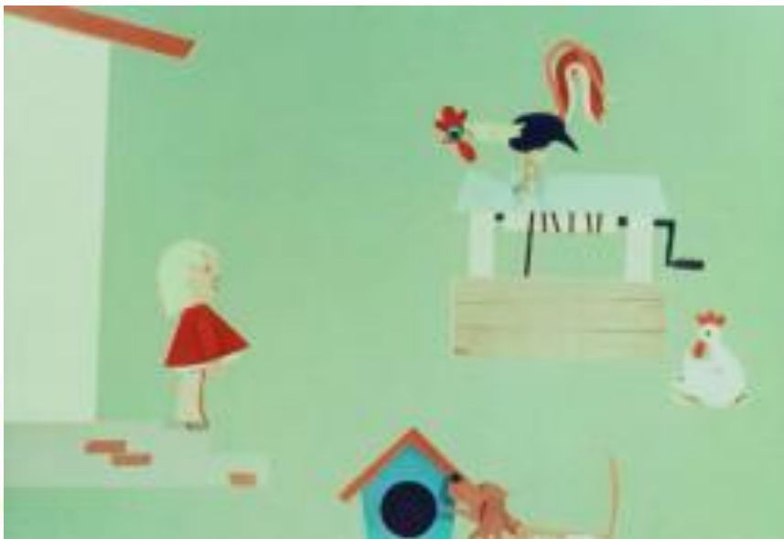
«Снегирь» — рисованный мультфильм 1983 года по одноимённому произведению писательницы («Союзмультфильм»)